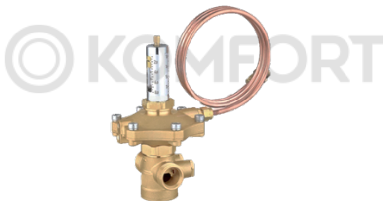
АРТ-R Ду 15-50