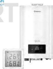
Электрические котлы и комнатные термостаты