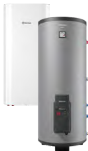
Комбинированные (косвенные) водонагреватели