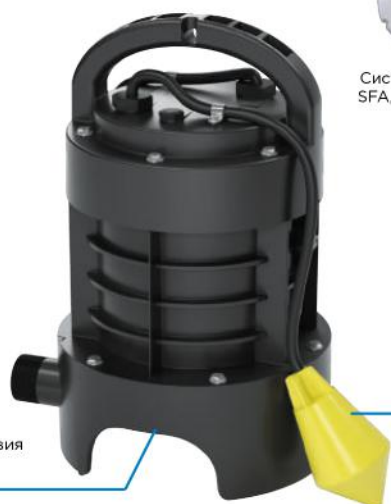
НАДЕЖНОСТЬ Дробильные лезвия ProX K2