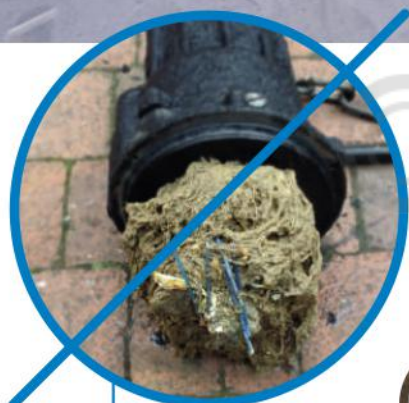
Заблокированный насос без системы измельчения

Засоренные трубы и незасоренные, благодаря использованию системы измельчения