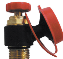
1 0276 0x