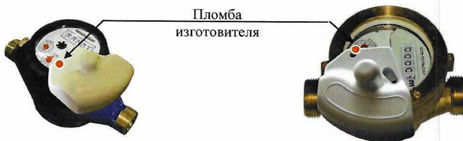
Рисунок 5 – Общий вид счетчиков исполнения Пульсар \text{MX}_1\text{-P}^{1)} и место пломбировки