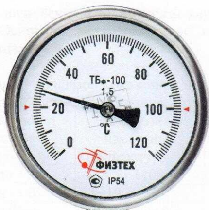
Рисунок 1 – Термометр ТБφ в корпусе 100 мм с осевым штуцером