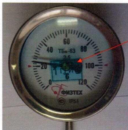
Рисунок 5 – Место нанесения знака поверки на стекло