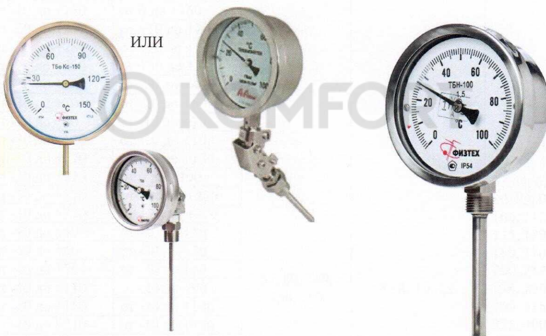
Рисунок 3 – Термометр ТБφ Кс в корпусе 150 мм с универсальным штуцером