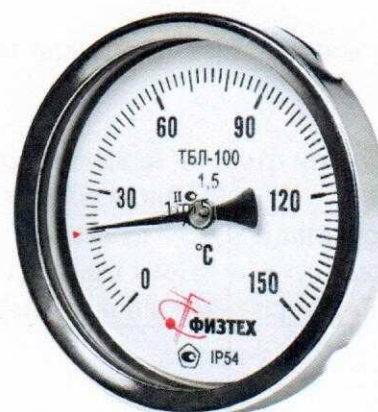
Рисунок 2 – Термометр ТБЛ в корпусе 100 мм с осевым штуцером