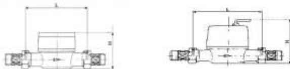
Рисунок 1. Габаритные и присоединительные размеры счётчиков воды BCX, BCXd, BCG, BCGd, BCT.