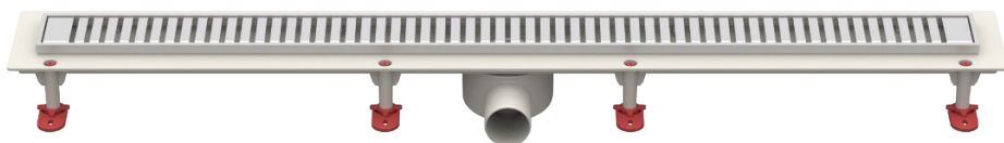
Рис.5 – Решетка тип D «Полосы»

Партия трапов, поставляемая в один адрес, комплектуется паспортом и объединенным техническим описанием в соответствии с ГОСТ 2.601-2006.