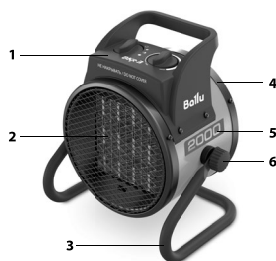
Рис. 1. Устройство прибора

При срабатывании термopредохранителя и отключении тепловентилятора из-за перегрева, он автоматически включится через несколько минут.