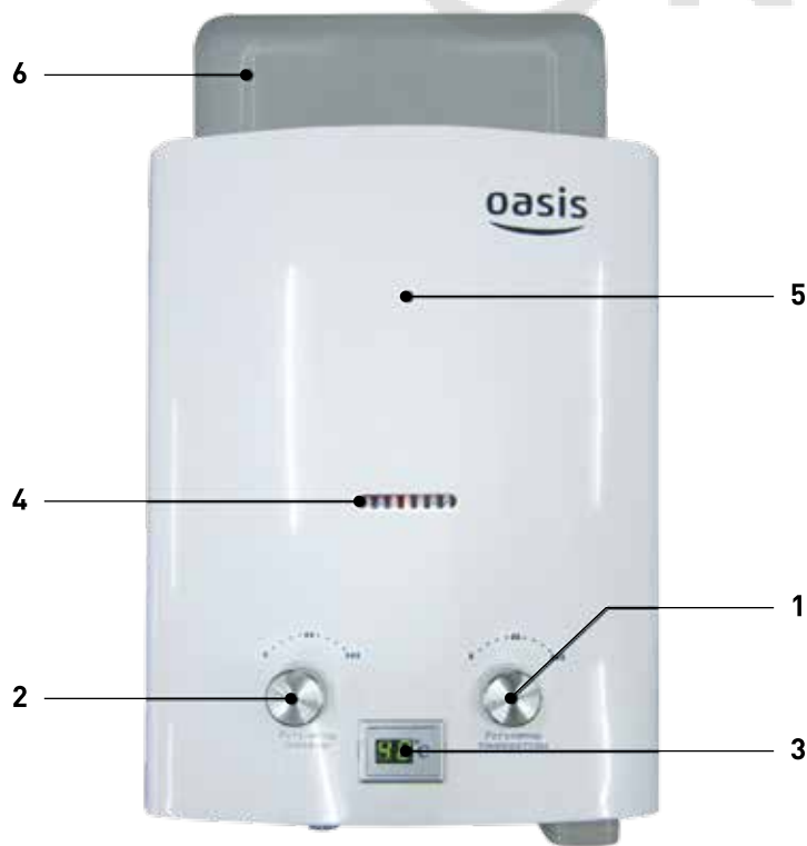
Рис. 1. Аппарат водонагревательный проточный газовый бытовой «OASIS» 1 - ручка водяного регулятора; 2 - ручка газового регулятора; 3 - цифровой индикатор температуры горячей воды; 4 - окно смотровое; 5 - облицовка; 6 - отражатель.

Составные части изделия, поясняющие принцип устройства аппарата и требующие технического обслуживания во время эксплуатации, показаны на Рис. 1.