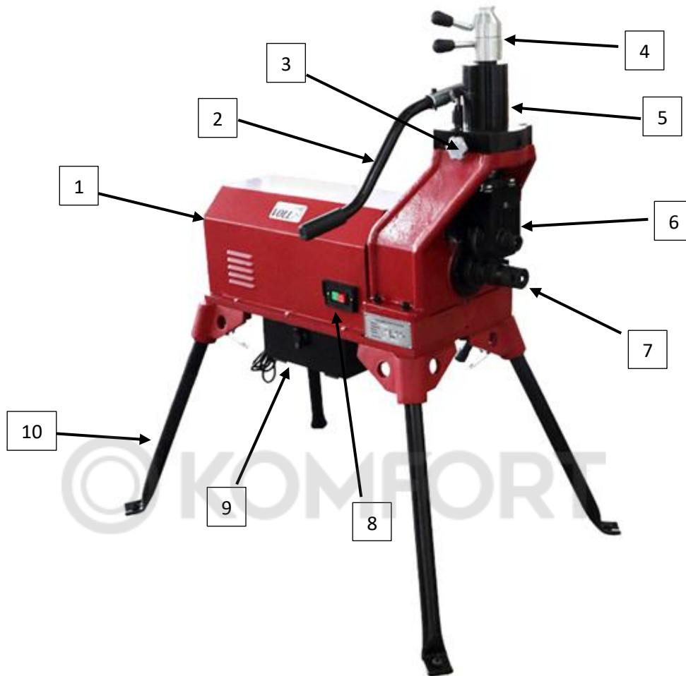
Рис. 1 Конструкция желобонакатного станка VOLL V-Groover