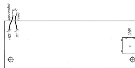
Рис. 8.2 Схема клеммников встроенного источника питания

Подключение внешнего питания 220 В (только для исполнения, содержащего источник питания) осуществляется в соответствии со схемой рисунка 8.2.