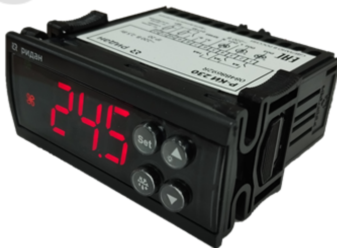
Рис. 1 Внешний вид контроллера

Контроллеры типа Р-КИ управляют холодильным оборудованием на основе заложенной в него программой. Контроллер получает сигналы от датчиков, сравнивает эти показания с параметрами, заложенными в контроллере (уставками) и на основе этого сравнения производит управление (закрывает, размыкает реле). Уставки возможно изменять через дисплей с кнопками управления или по сети ModBus, к которой контроллер подключен при помощи встроенной сетевой карты.