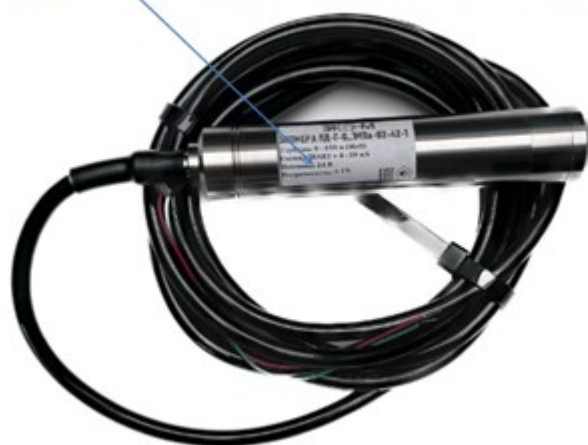
Рисунок 2 – общий вид преобразователей давления ЭКОМЕРА ПД-Г

Место нанесения заводского номера и знака утверждения типа