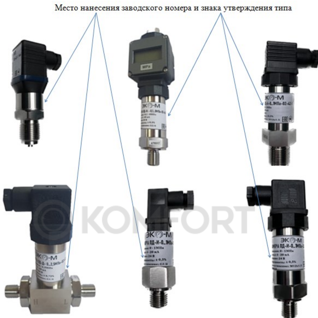
Рисунок 1 – общий вид преобразователей давления ЭКОМЕРА ПД-А, ЭКОМЕРА ПД-И, ЭКОМЕРА ПД-Д, ЭКОМЕРА ПД-ИВ

Место нанесения заводского номера и знака утверждения типа