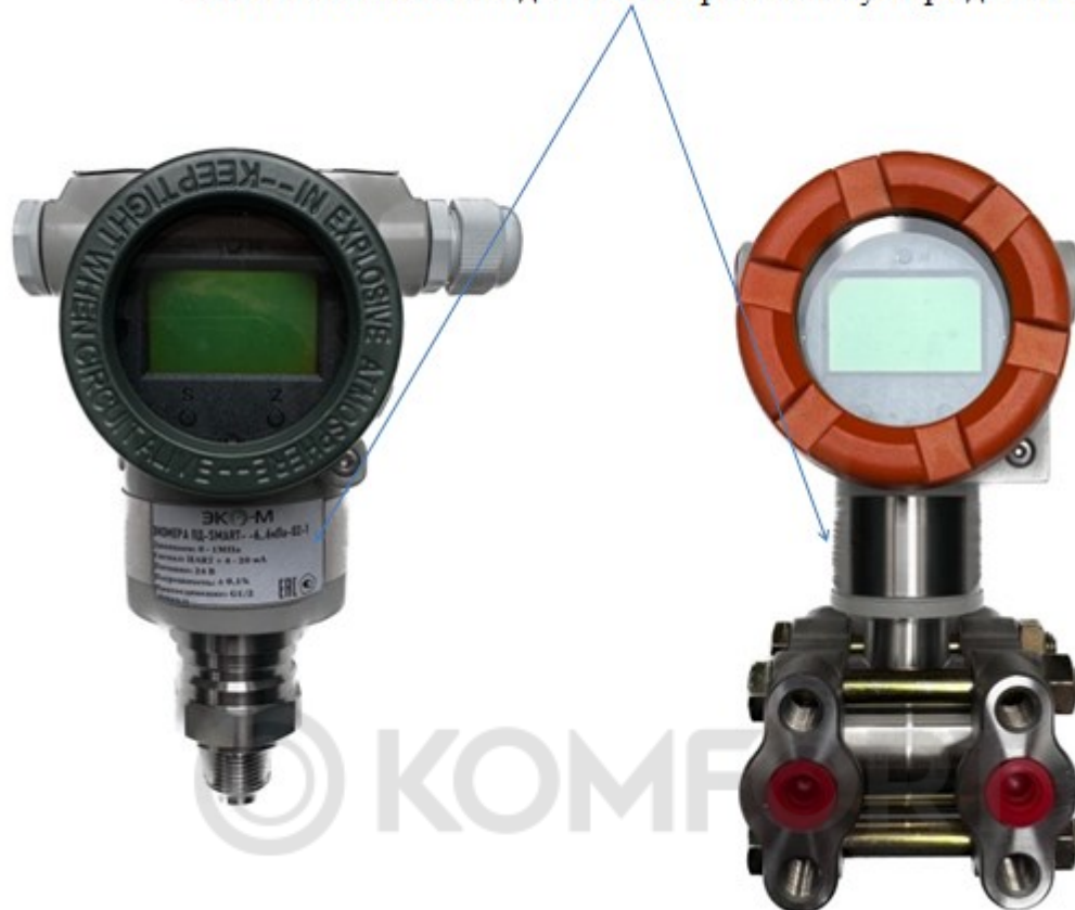
Рисунок 3 – общий вид преобразователей давления ЭКОМЕРА ПД-SMART

Место нанесения заводского номера и знака утверждения типа