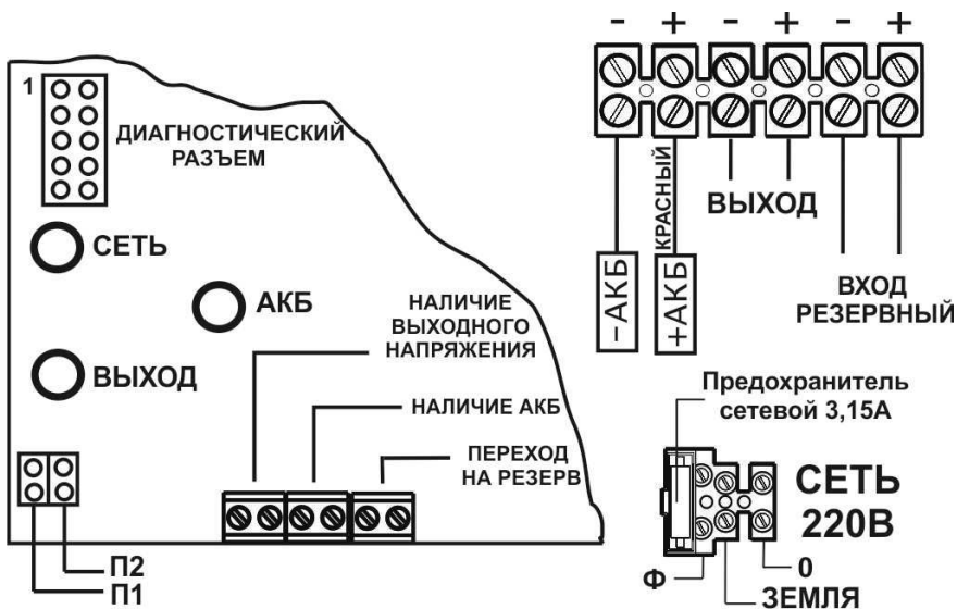
Рисунок 1. Вид источника с открытой крышкой (схема подключения)