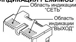
Рисунок 1 — Индикация режимов работы

В диапазоне входных напряжений от 165 В до 260 В, при правильной фазировке и отсутствии напряжения между «Землей» и «Нулем», индикатор «СЕТЬ» горит непрерывно, если же входное напряжение меньше 165 В или больше 260 В, индикатор «СЕТЬ» начинает мигать 1 раз в секунду.