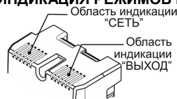
Рисунок 1 — Индикация режимов работы

В диапазоне входных напряжений от 165 В до 260 В, при правильной фазировке и отсутствии напряжения между «Землей» и «Нулем», индикатор «СЕТЬ» горит непрерывно, если же входное напряжение меньше 165 В или больше 260 В, индикатор «СЕТЬ» начинает мигать 1 раз в секунду.