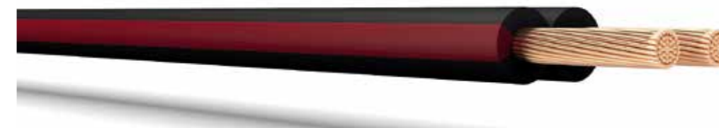
Шнур с параллельно уложенными жилами с поливинилхлоридной изоляцией.

ЕАС 000 "ККЗ" ПуГВнг(А)-LS 1x25 450/750 ТУ 3551-024-38229892-2021 ГОСТ 31947-2012 03.2023 РФ