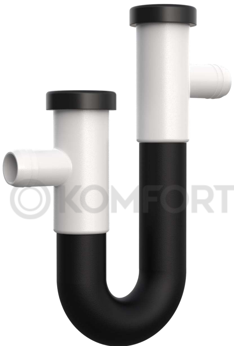
Сифон для сбора конденсата G-34